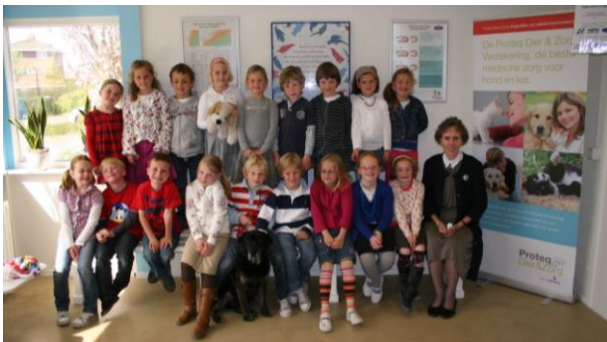
Klassenfoto in de dierenkliniek na een rondleiding

Zoals al langer bekend is zijn veel mensen erg actief op deze diverse media en worden graag geïnformeerd over de meest uiteenlopende zaken. U kunt ons vinden door op de links te klikken, die te vinden zijn op de homepage van onze website ( www.dierenkliniekgo.nl )