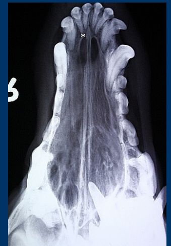
Digitale röntgenfoto van de bovenkaak van een hond.

Gezien de geweldige positieve reacties, hebben we in overleg besloten de gebitscontroles het hele jaar 2011 gratis te verrichten door onze gediplomeerde paraveterinair