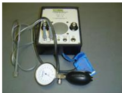
Apparatuur voor bloeddrukmeting

Twee weken na de start van de medicatie kwam Sheeba op controle om de bloeddruk te meten. De bloeddruk was al goed gedaald. Deze was nu 235mmHg! Nog steeds te hoog, maar niet te vergelijken met de waarde van 320 mmHg. De dosering van de bloeddrukverlagende medicatie hebben we iets verhoogd.